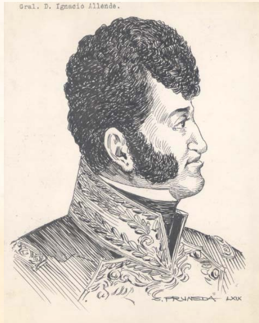
Ignacio Allende , Salvador Pruneda, tinta sobre papel / Archivo Gráfico de El Nacional , Fondo Gráficos, 1969. INEHRM.

En este Expediente Digital se presenta un recorrido por su trayectoria, retomando algunos documentos que destacan el preponderante papel que desempeñó durante la guerra de Independencia, en la que, al lado del cura Miguel Hidalgo, comenzó la ruta para el nacimiento de nuestra nación.