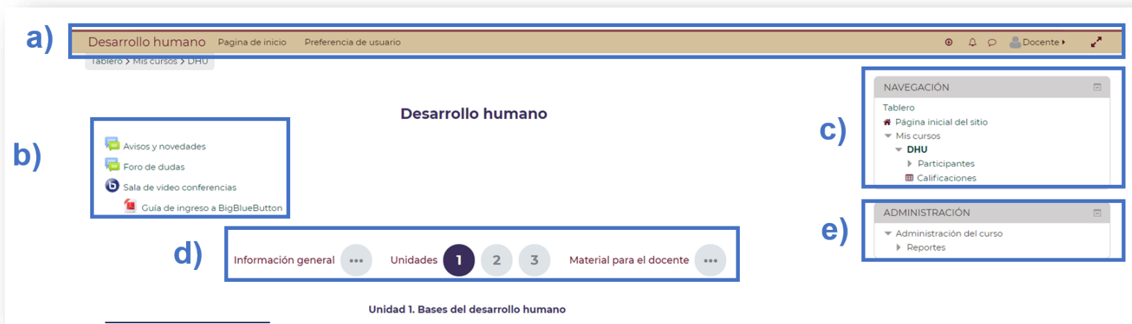
Figura 5. Pantalla principal de aula virtual. Elaboración propia.

Nota. La visualización del aula virtual puede variar de acuerdo al programa educativo.