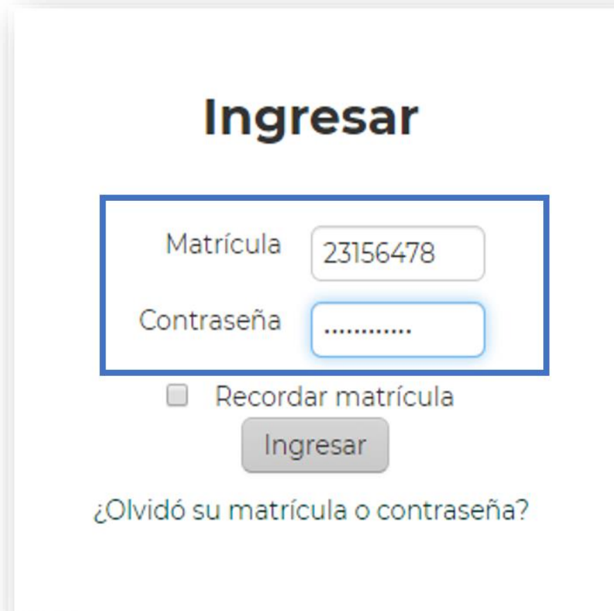
Figura 4. Ingreso de claves de acceso. Elaboración propia.

5. Se abrirá una nueva ventana, la cual le solicitará ingresar su Matrícula y Contraseña . Considere que sus claves de acceso fueron enviadas con anterioridad y se localizan en el correo electrónico con el cual se registró en la universidad.